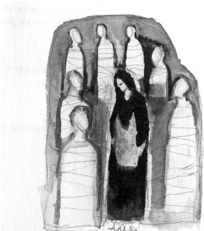
Illustratie: Annemarie van Ulden, uit "De Eerste Dag")